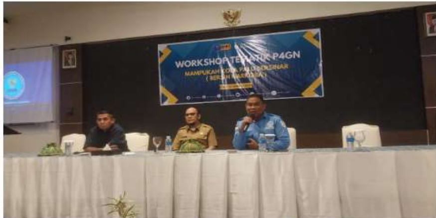
Badan Narkotika Nasional (BNN) Kota Palu akan melaksanakan kegiatan Workshop Tematik P4GN, dengan Tema "Mampukah Kota Palu Bersinar (Bersih Narkoba)", Selasa (27/8/2024), bertempat di Palu Golden Hotel.

TALISE, MERCUSUAR – Badan Narkotika Nasional (BNN) Kota Palu akan melaksanakan kegiatan Workshop Tematik P4GN, dengan Tema "Mampukah Kota Palu Bersinar (Bersih Narkoba)", Selasa (27/8/2024), bertempat di Palu Golden Hotel. Kegiatan ini dihadiri oleh puluhan peserta, yang terdiri dari elemen mahasiswa, jurnalis, organisasi kepemudaan, serta perwakilan masyarakat.