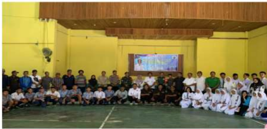
Sosialisasi dan penyuluhan bahaya narkoba di perbatasan