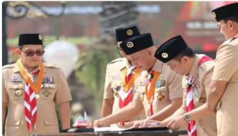
Penandatanganan PKS Kwarda Jatim dan BNN Jatim tentang pencegahan dan pemberantasan penyalahgunaan dan peredaran gelap narkoba dan prekursor narkoba dalam upacara peringatan Hari Pramuka ke-63 Tahun 2024 di Gedung Negara Grahaadi, Surabaya, Selasa (27/8/2024).

RIAUMAKMUR.COM - Kwartir Daerah (Kwarda) Gerakan Pramuka Jawa Timur melakukan penandatanganan Perjanjian Kerja Sama (PKS) antara Ketua Kwarda Jatim dengan Badan Narkotika Nasional Provinsi Jawa Timur (BNN Jatim) tentang pencegahan dan pemberantasan penyalahgunaan dan peredaran gelap narkoba dan prekursor narkoba. Penandatanganan tersebut bertujuan untuk mendorong para anggota pramuka turut andil dalam memerangi narkoba.