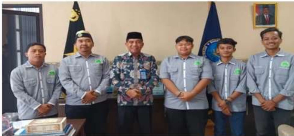
Sejumlah pengurus PW IPNU Banten berkunjung ke Kantor BNN Banten, Selasa (27/8/2024).

Kabupaten Serang, NU Online Banten Kepala Badan Narkotika Nasional (BNN) Provinsi Banten Brigjen Pol Rohman Nursaid mengapresiasi Ikatan Pelajar Nahdlatul Ulama (IPNU) yang siap berpartisipasi dalam memerangi narkoba di Banten. "Kami pihak BNN sangat bahagia dengan silaturahmi ini, sehingga tugas BNN ke depan akan lebih mudah dengan adanya kesadaran dan keterlibatan organisasi seperti IPNU," ujarnya saat menerima sejumlah pengurus Pimpinan Wilayah (PW) IPNU Banten seperti dalam keterangan tertulis yang diterima NUOB, Rabu (28/8/2024).